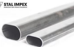
Rury stalowe płaskoowalne