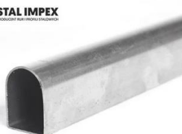
Rury stalowe półowalne